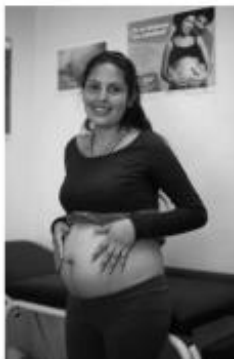
Policlinico Julián Grimau García Santiago de Cuba