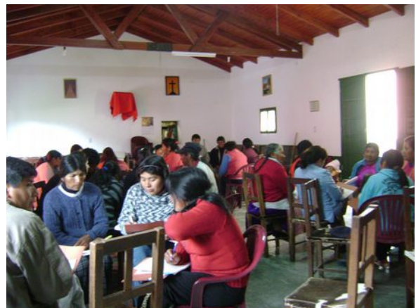
Con la violencia no te encierres.