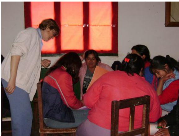
Co-construyendo el concepto de violencia.