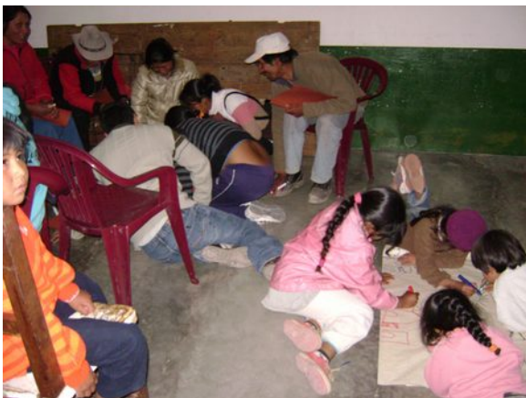
Sembrando con y en la comunidad.